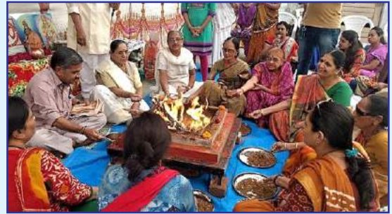
રવિકુંજ ફ્લેટ, ઘાટલોડિયા