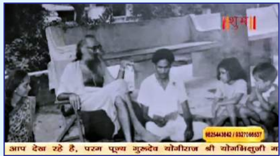
ડોક્યુમેન્ટરી ફિલ્મ - શુભ ચેનલ