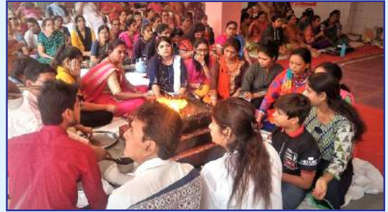
સુમન સજની હોલ, મણિનગર