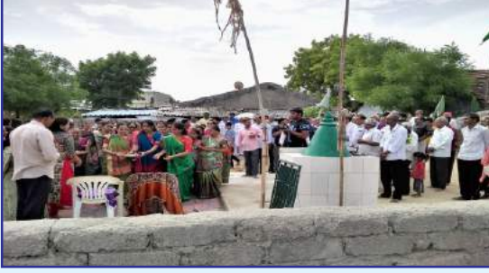
ગામ : નદાણ (પૂ. ગુરુજીની જન્મભૂમિ)