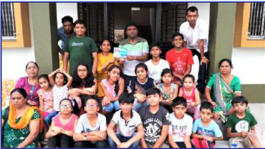
બાળ સુસંસ્કાર સિંચન શિબિર - હાથીદ્રા