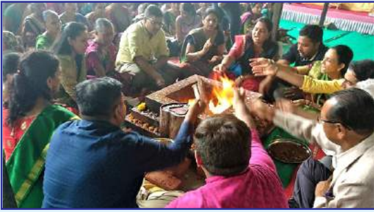
સંસ્કાર ધામ - નદાણ