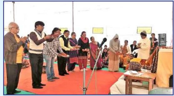
નિર્વિકલ્પ મુક્તિધામ - પલિયડ