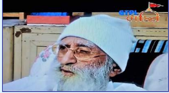
ડોક્યુમેન્ટરી ફિલ્મ - જીટીપીએલ ભક્તિ