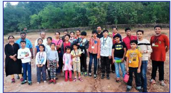
બાળ સુસંસ્કાર સિંચન શિબિર - ખંબુઘોડા